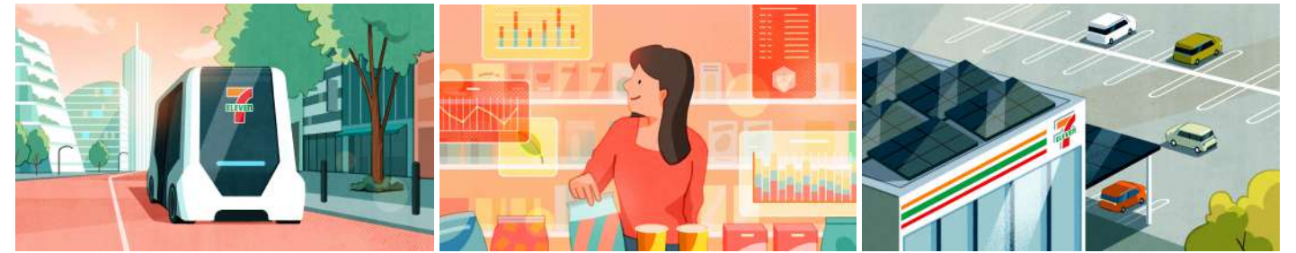
セブン-イレブン 50周年記念「4visions」