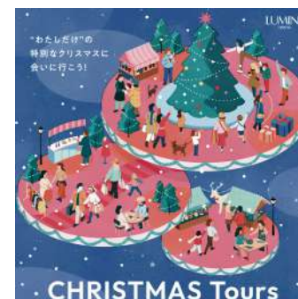
LUMINE OMIYA CHRISTMAS TOURS