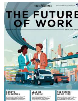
FORD X THE SUNDAY TIMES