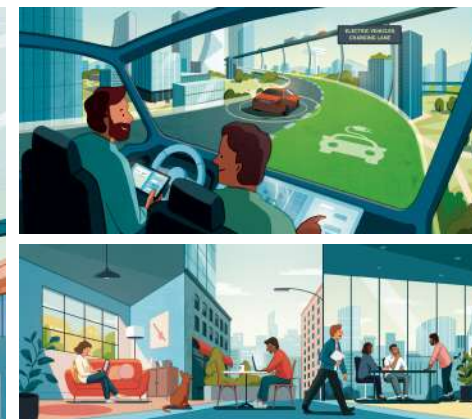
YOUTUBE POSITIVE IMPACT CAMPAIGN