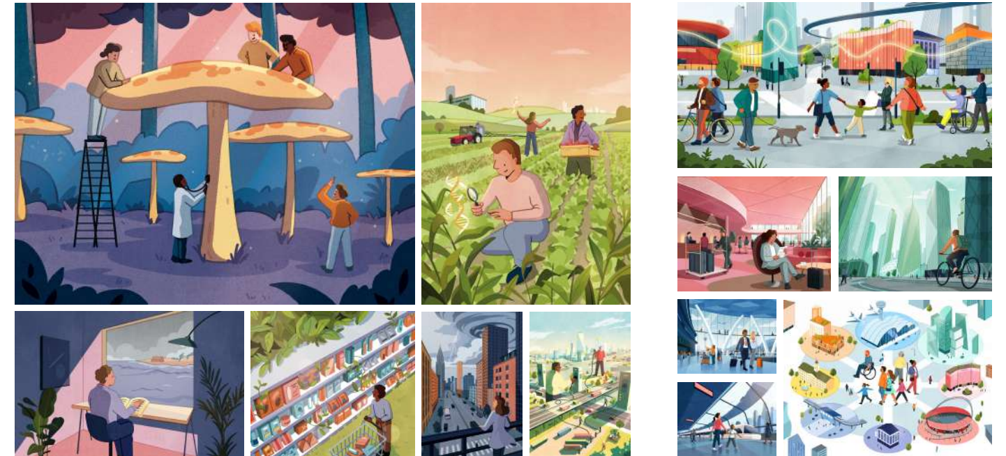
WIRED WORLD ANNUAL