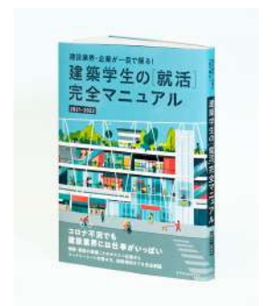
建築学生の[就活]完全マニュアル