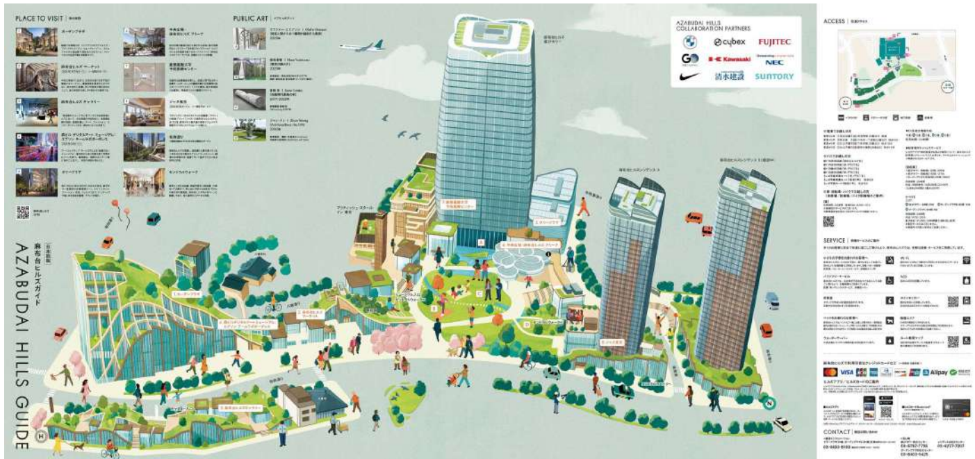
麻布台ヒルズ フロアガイド